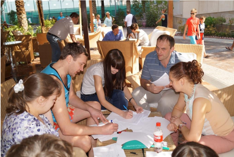
(Командное решение кейса)

Интегрируем компетенции для профессионального управления Ваши ми проектами