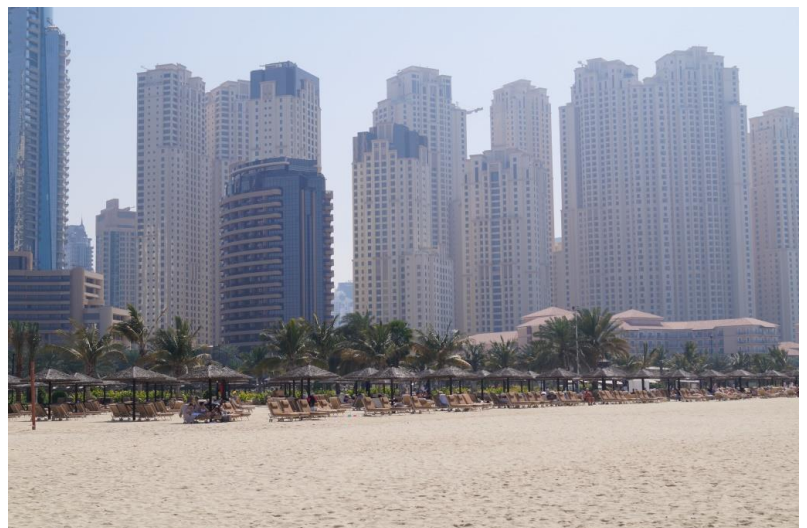
(Повседневные достижения Проектного управления в Дубае)

С одной стороны это был бонус по итогам 2013г. и последнего совместного проекта двух компаний – «100 больниц», с другой стороны стояла конкретная бизнес-задача – разработать сценарий деловой игры и отработать Бизнес-процесс управления Группой компаний «Диалог». Данный процесс был описан и утверждён у руководства Группы компаний в ходе проекта «Система продаж», который реализуется в данный момент в компании.