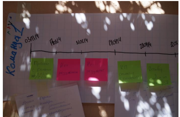
(«Дорожная карта» проекта)

Празднование 10-летия прошло с максимальным эффектом для всех – команда Группы компаний смогла не просто отдохнуть, но и сделать задел на будущее, понять точки роста и повышения эффективности, получить заряд энергии и положительных эмоций.