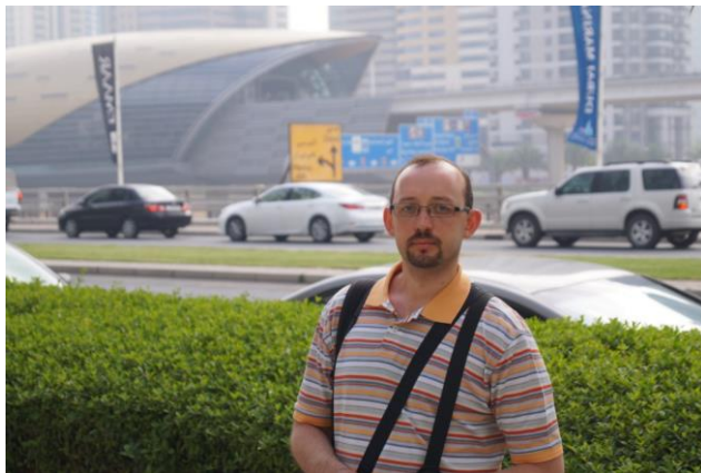
(На фоне станции метро)

Первые впечатления от посещения ОАЭ и в частности Дубая – «Вот, где живёт и развивается настоящее, профессиональное проектное управление. Управление проектами, которое реальное, а не на бумаге, в красивых отчётах!» Именно в ОАЭ по-настоящему ценятся три важных ресурса проекта: сроки, цена и качество – например, когда у местных строительных компаний стоит жёсткое требование – завершить проект день в день и если не успел – договор расторгают, недостроенный объект сносят за счёт строительной компании.